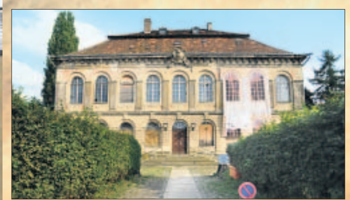
Noch ist die Tür verschlossen: Zum „Tag des offenen Denkmals“ steht sie jedoch für jeden Interessierten offen.